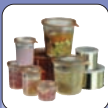
Sterilisieren von Konserven