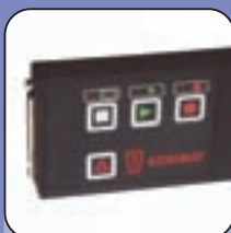
Datenrecorder zum Aufzeichnen von Sterilisationsprotokollen