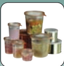
Sterilisieren von Konserven