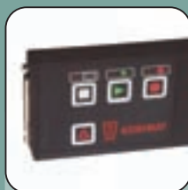
Datenrecorder zum Aufzeichnen von Sterilisationsprotokollen