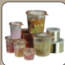
Sterilisieren von Konserven