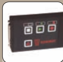
Datenrecorder zum Aufzeichnen von Sterilisationsprotokollen